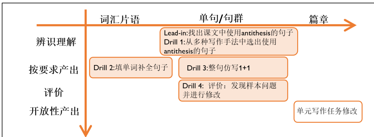
(图 2: 展示环节课堂促成活动设计思路, (邱琳, 2017))