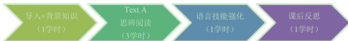
图 1 单元学时分配

基于学情分析和单元教学目标，本单元的教学过程分为四个阶段共六学时完成，具体分配如下：