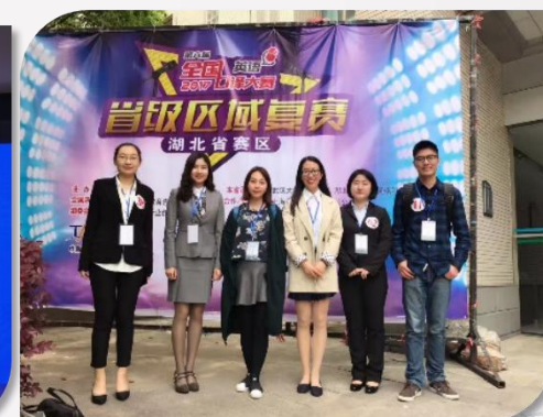
第六届全国口译大赛三等奖2项，优秀奖2项