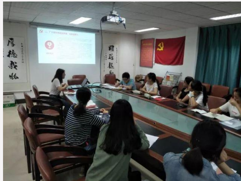
本科生第二党支部学习习总书记在北京大学师生座谈会上重要讲话精神

基层党支部与学生结对，就专业学习、心理适应、就业理念等对学生加以引导。同时，把维护主流文化与意识形态安全融入校园文化活动中，引导学生在跨文化交流和中西文化对比中发现、汲取和肯定中国特色社会主义文化的思想精华和道德精髓。