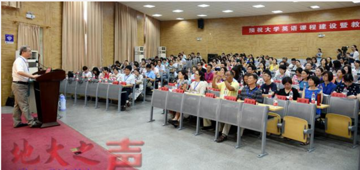
2017年7月，“大学英语课程建设暨教师发展研讨会”