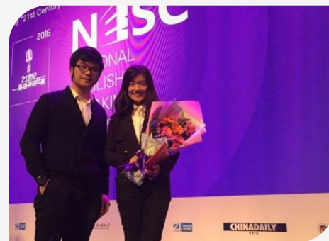
卜格获第二十一届“21世纪·可口可乐杯”演讲比赛全国三等奖