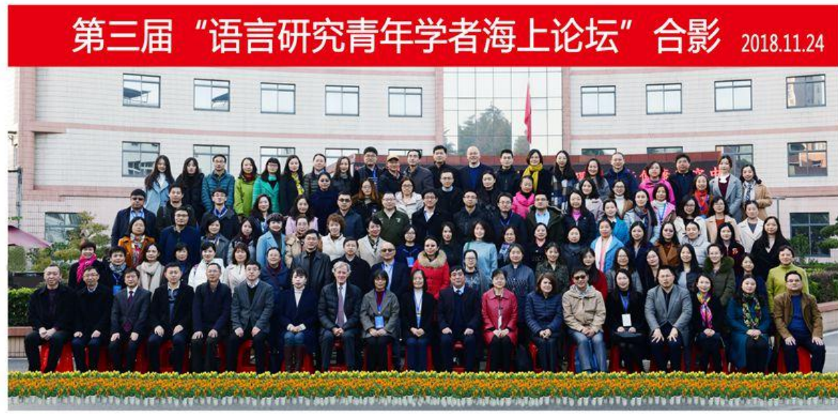
2018年11月，第三届“语言研究青年学者海上论坛”