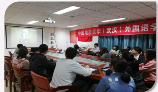
国家安全教育视频课