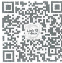
“外研社高等英语资讯”微信公众号

微信公众号： 请扫描以下二维码关注“外研社高等英语资讯”微信公众号（微信号 linkandthink）。大赛组委会将通过本微信号发布大赛相关信息。