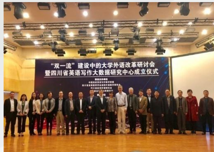
四川省英语写作大数据研究中心正式落户我校， 为我校学生英语写作能力训练提供了充分保障

在综合性大学中，作为非一流学科建设的外语学科，需要借力学校双一流建设，融入学校发展的主流中，跨越式地促进自身发展；同时，又要尽全力利用外语优势，服务于学校“双一流”建设。