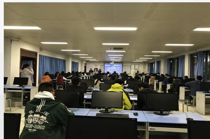
大学英语四六级口语考点一期工程顺利完成， 组织考试20场次，考生1760人