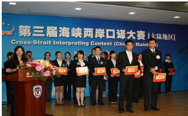
第三届海峡两岸口译大赛大陆地区决赛一等奖