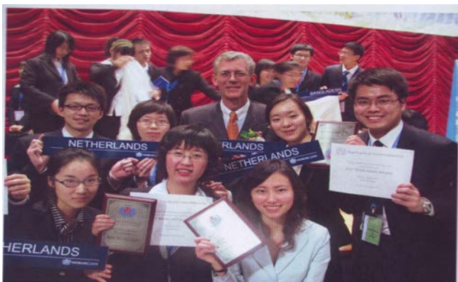
学生赴香港参加模联