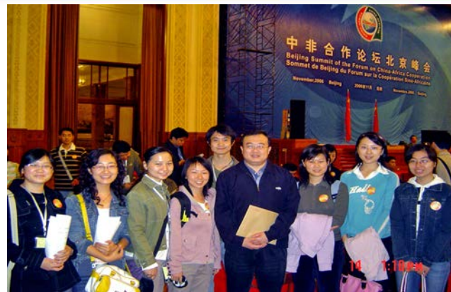
学生在中非论坛担任翻译、陪同