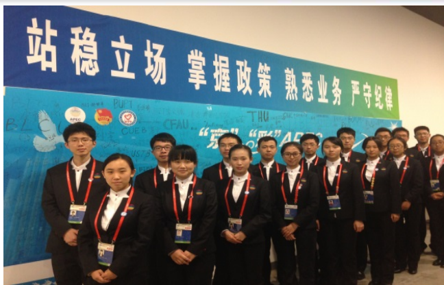
学生担任APEC领导人会议志愿者