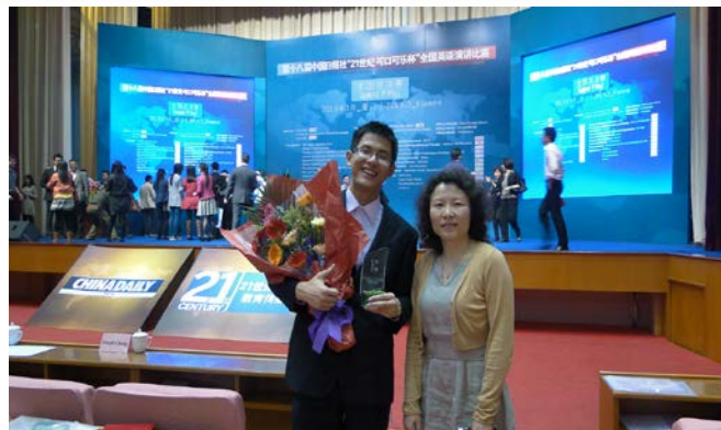
第十八届 21世纪杯全国英语演讲比赛季军