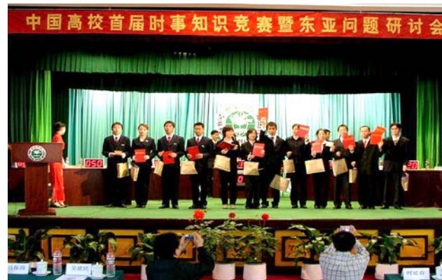
学生参加东亚问题研讨会