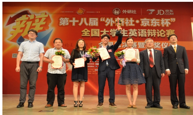
蝉联第十八届和第十九届外研社杯英语辩论赛冠军