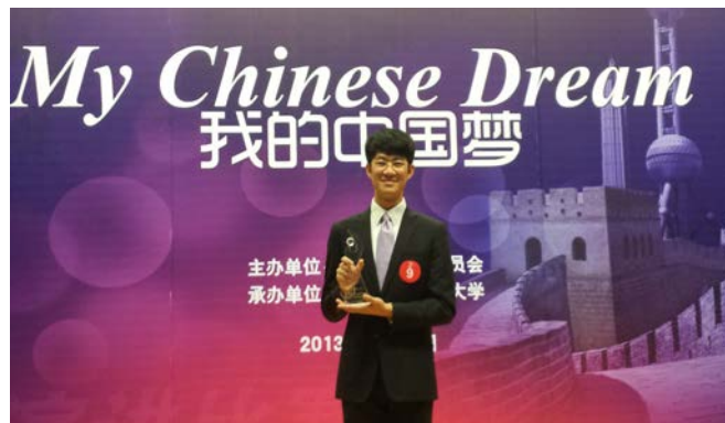
第五届北京市大学生英语演讲比赛冠军、特等奖