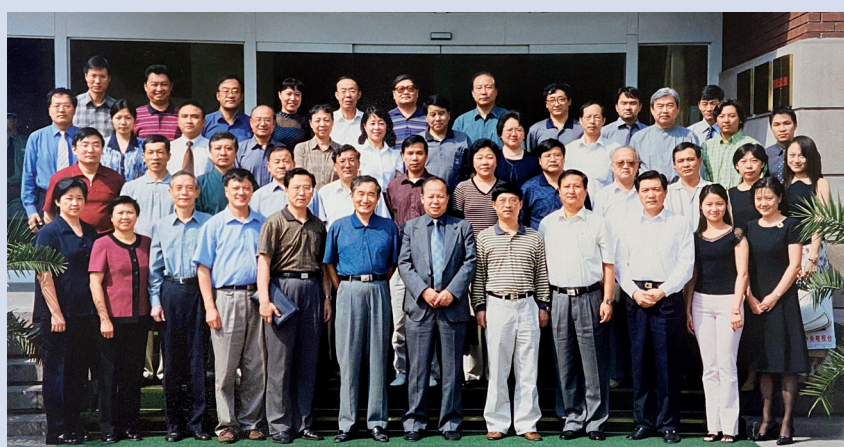
“CCTV 杯”全国英语演讲大赛组委会第一次全体会议

外语教学与研究出版社（FLTRP）以时代的担当精神联合发起并成功举办了首届“CCTV 杯”全国英语演讲大赛。当年的大赛宗旨明确提出，“随着中国加入世界贸易组织和北京申奥的成功，英语这一国际通用语言在中国人民生活中占据了越来越重要的地位。为了进一步满足我国日益扩大的国际交往需要，为举办2008年奥运会营造相当的语言环境，让世界了解中国，让中国走向世界；同时为提高全国人民的英语水平，满足社会对各方面人才的外语能力，特别是英语口语技能的要求，中央电视台英语频道、外语教学与研究出版社决定联合主办‘CCTV 杯’全国英语演讲大赛”。