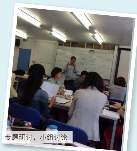
专题研讨，小组讨论