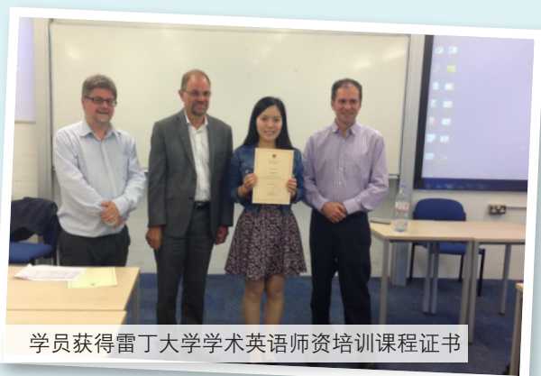
学员获得雷丁大学学术英语师资培训课程证书