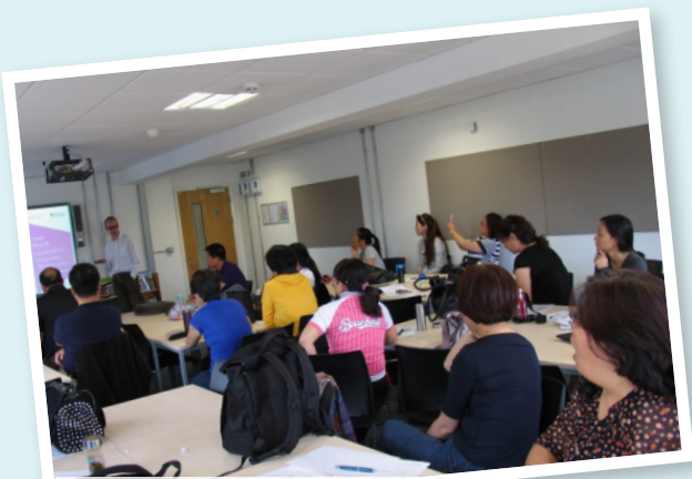
ISLA培训中心主任给学员授课