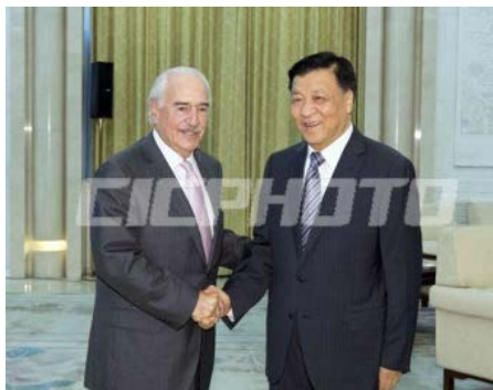
刘云山会见中间民主 党国际主席、哥伦比 亚前总统帕斯特拉纳