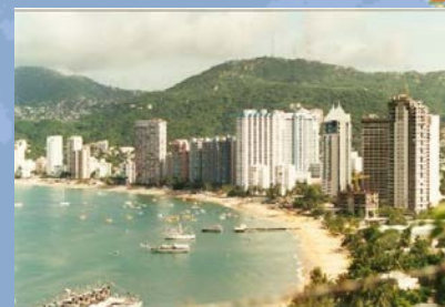
墨西哥 Acapulco 阿卡普尔科