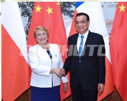
李克强会见智利 总统巴切莱特