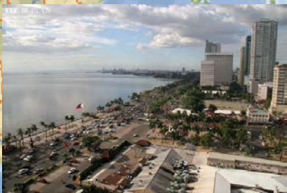
菲律宾 Manila 马尼拉湾