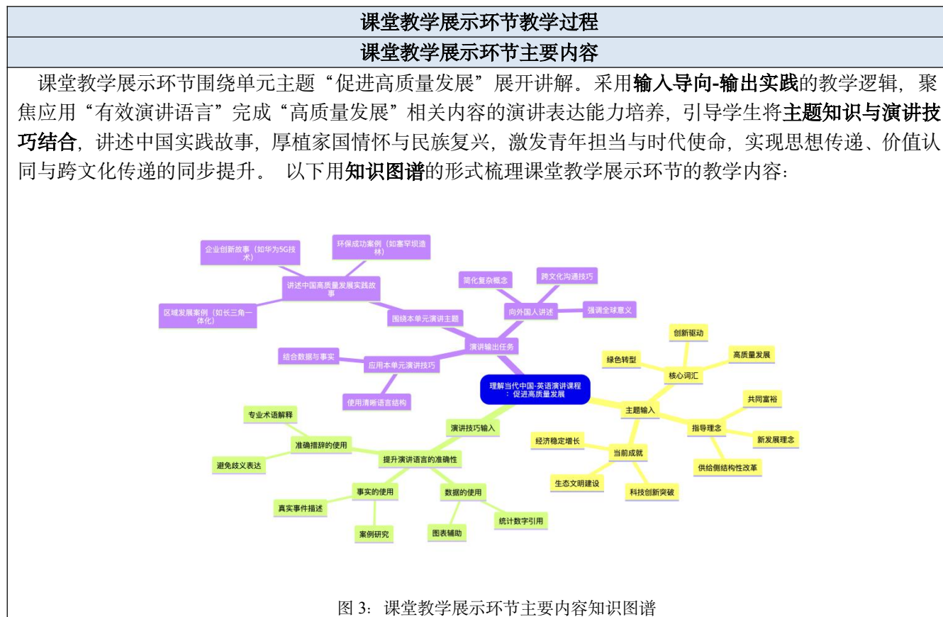
图 3：课堂教学展示环节主要内容知识图谱